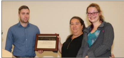
Remise du certificat de reconnaissance VIO pour avoir soutenu et accompagné une victime de violence conjugale en assurant son bien-être et sa sécurité sur les lieux de son travail.